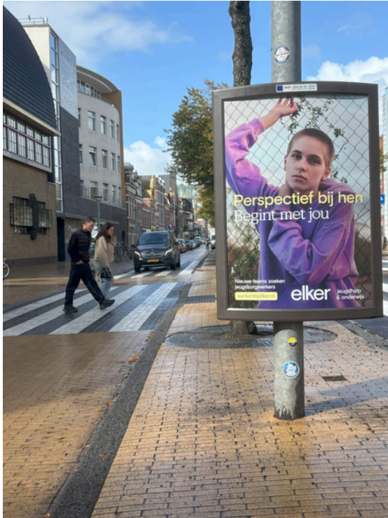
Poster in binnenstad Groningen

Dit jaar werkten we toe naar de volgende stap in de afbouw én ombouw van de JZ+. We gaan voor een gezonde, kleinschalige en veilige plek. Waar jongeren in feite werken aan het leggen van een basis, vanuit waar ze verder kunnen. Perspectief krijgen op een behandeling en begeleiding die past bij wat ze nodig hebben.