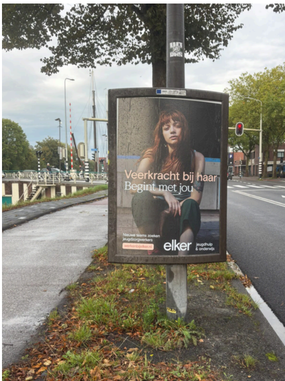
Poster in Gronings straatbeeld

Voor deze nieuwe teams gingen we multidisciplinair aan de slag: want werving alleen is niet voldoende. Met teammanagers, gedragswetenschappers en andere experts zetten we een trainingsprogramma op dat direct bij de start van 2026 van start kan gaan.